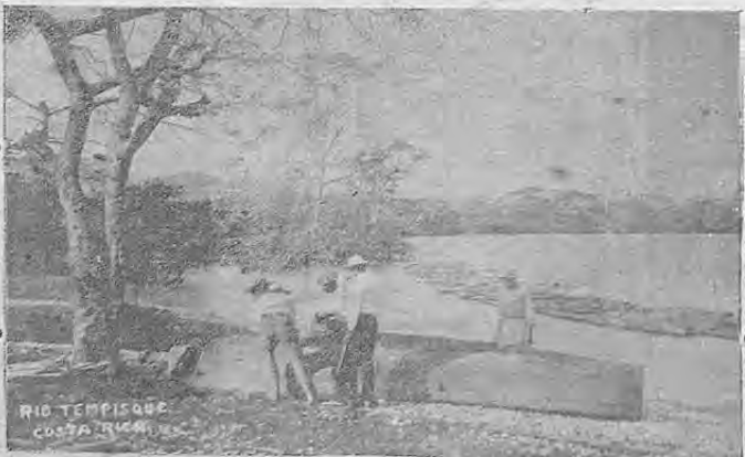
Vista del Río Tempisque que desemboca en el Golfo de Nicoya

Saltando fuera del agua con todo el peso de sus robustas arbores, unas manchas de bufoes siguen la embarcación que marcha ya con todo el poder de su motor que golpea isocronamente como un ariete en la entraña de la nave, en el «departamento de máquinas» como dice pomposamente el capitán. Los bufoes brincan por los costados y el sol brilla en sus escamas que reflejan como laminitas de plata; parecen guardianes del barco, escolta de honor: se dijera que es nuestra pequeña barca gasolinera un acorazado guardado por flecos y rápidos torpederos que navegan sobre sus dos bandas.