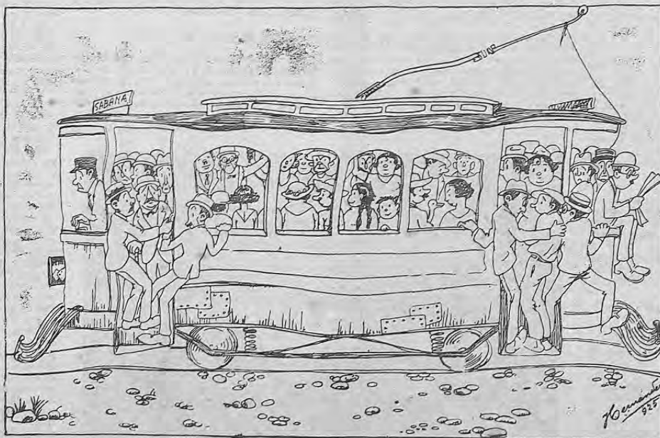
Especie de acordón, llamado aquí tranvía (!) que en virtud de su elegancia, comodidad y rapidez (5 horas 78 minutos cada trayecto) fué autorizado por nuestra estupenda Municipalidad a elevar sus tarifas.