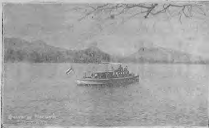
Vista del Golfo de Nicoya